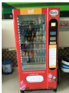
ファンタオレンジ1本 50円！

おー！自動販売機！と思わず写真を撮りました。しかし、「病院にはいっぱいありますよ」と言われました。ベトナムには硬貨がほとんどなく、(たまにある)お札が柔らかいのです。おそろおそろ通してみました。なんとスムーズに飲み込んでいきました。なかなかやりおりました。日本の方がお札ははじかれるかもです。