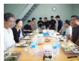
みんなで昼食! いつもの125円弁当! ぜんぶ頂きました!