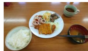
とんかつ、パスタサラダ、こんにやくのピリ辛煮、イカとブロッコリーの炒め物