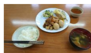
豚肉と大根と玉子の煮物、ししゃも天ぷら、鶏肉ときょうりの梅肉和え