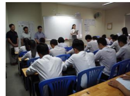
ベトナムの実習生送り出し機関 HITECOでの授業風景。 このクラスは日本に行くことが決まっている人達のクラス。みんな真っ直ぐな目です。