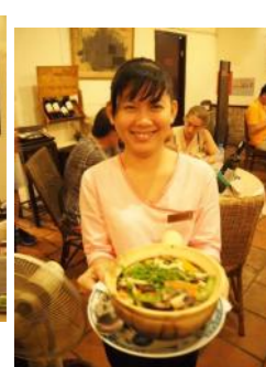
店員さんのこの笑顔! 素敵でしょ?