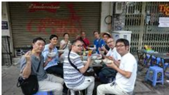
路上にてお昼ごはん! 平日は行列のお店 THANH XUAN