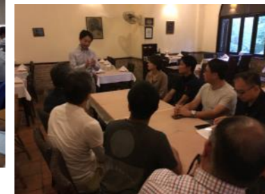
夜の営業前に時間をとって体験をお話ししました。ありがとうございます