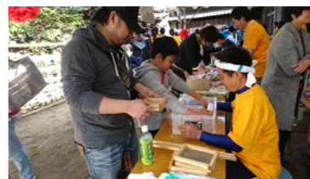
紙すき体験による朱印帳作り

先月号でご紹介した【高津の宮 あきんど祭りのこと】11月12日(日)、超晴天の中、大阪市中央区にある高津宮にて開催されました。予想をはるかに上回る来場者数でした！来ていただいた方、心より感謝いたします。ダット君・ターイ君も他の会社の実習生と来てくれました！(三島あゆみ)