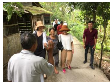
おとーさん! おかーさん! また来たよー! とびきりの笑顔で迎えてくれました! 嬉しいなあ~ 再訪の約束を果たせました!