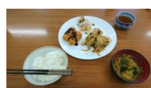
鮭のちゃんちゃん焼き、菊芋の豚肉巻きフライ、切り干し大根の酢の物