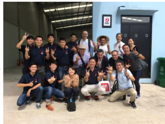
MGKのみんなと楡の木メンバーで world peace!