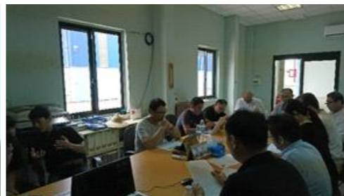
みんなの前で私たちが体験してきたことを発表をさせていただきました。