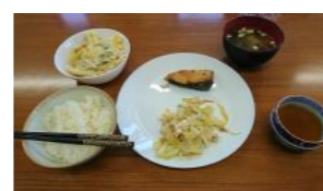
ぶり照り焼き、マカロニグラタン、鶏肉とキャベツの柚子胡椒和え