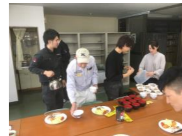
みんなで手伝いながら準備しています。