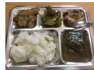
これはベトナムでのおべんとう