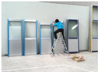
工場長がシール打ちをしてくれています。