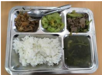
ちなみに今日のお昼はこんな感じ。 もちろん、廣井部長持参のふりかけは 一日一袋無くなる勢いで食べてます(笑) ありがとうございます！