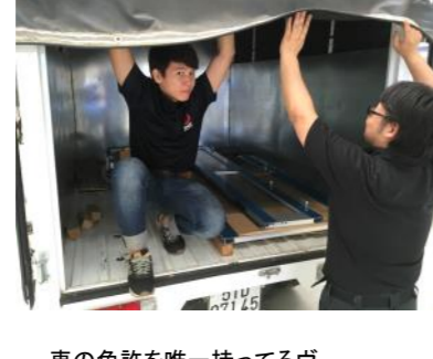
車の免許を唯一持つるヴー。 大活躍です。