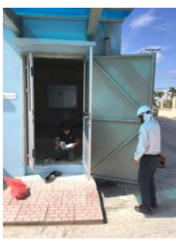
某事務所、玄関部部 サッシの取替です。