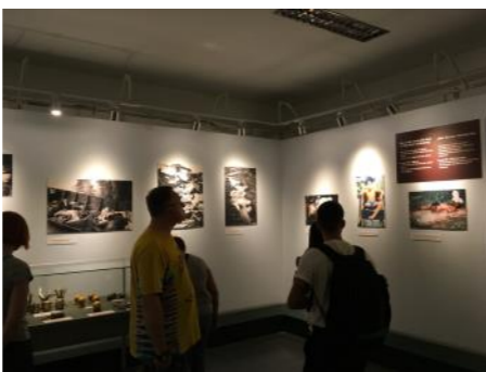
大好きな人とこんな形で離れることは辛 かっただろうと思います。

この悲しみを他人事として無駄にしては いけない。 絶対に戦争を繰り返してはいけない。 少しでも幸せな未来を子供たちに 渡すことが、この人達に報いること。