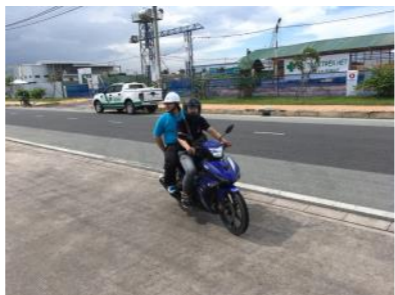
工場長がバイクで現場に入ります。 ちょっとカッコイイ??