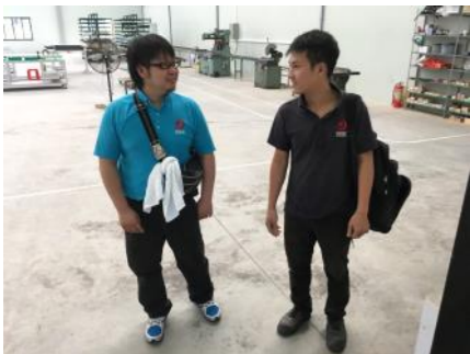
タインと三宅工場長、久しぶりの再会！