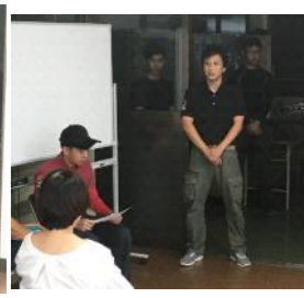
これは「ひよこり。」ではなく「ひよこりソ」。。