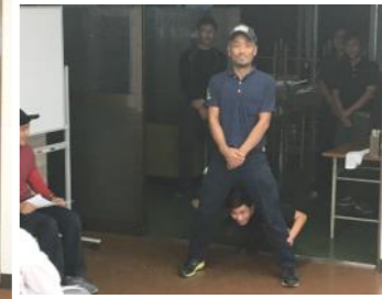
こちらは「ひよこりはん」ならぬ「ひよこりソ」。。