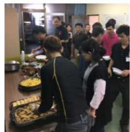
今回はパイキング形式で。