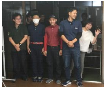
パフォーマンスでの「ひよこりはん」