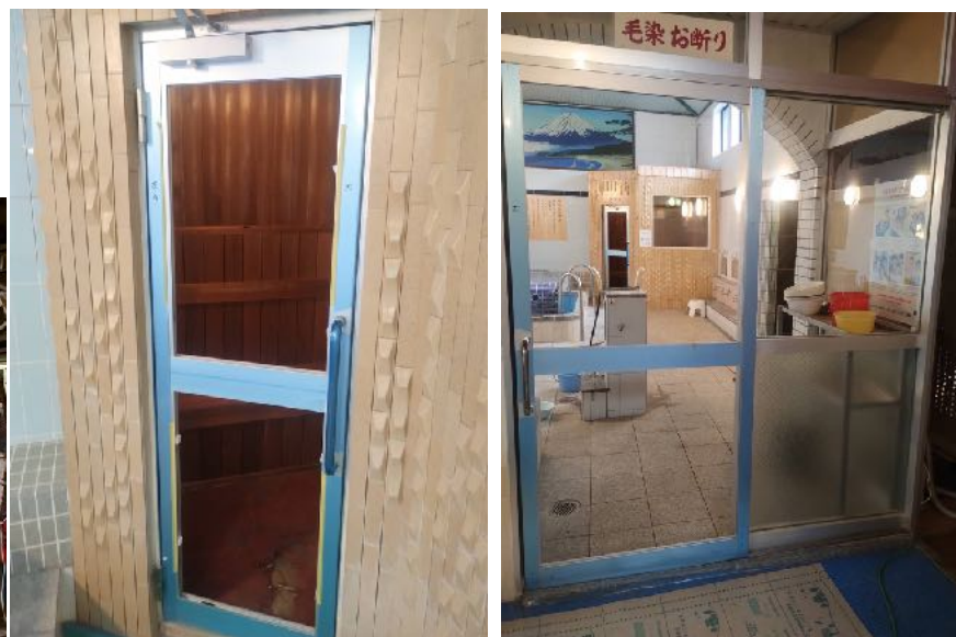
サウナ室の扉交換