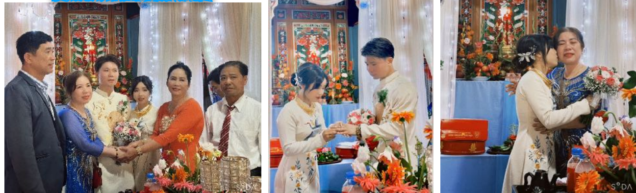
ソンちゃん、おめでとう！ 結婚式の写真は次月号にて。