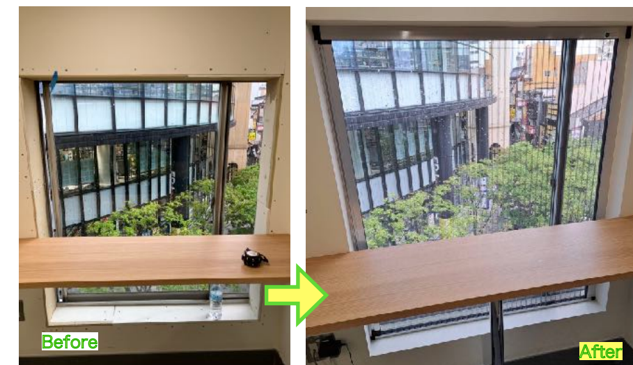
メタコ インテリア網戸側面付